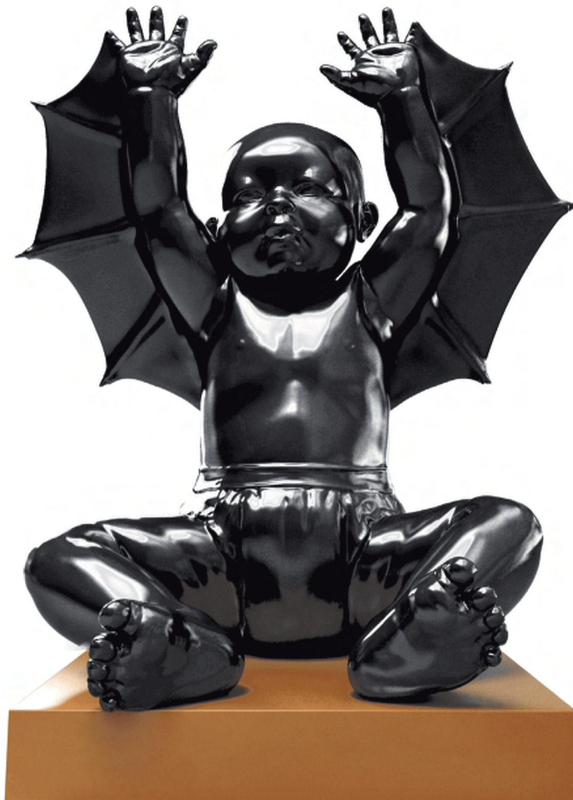
Angels-Demons. AES+F, 2008/09, fiberglass & stainless steel, edition of 2, about 5 meters high